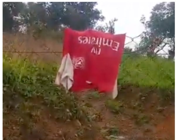
Soccer uniform used as rags and tossed outside 掃除用に使われ捨てられていたサッカーウェア