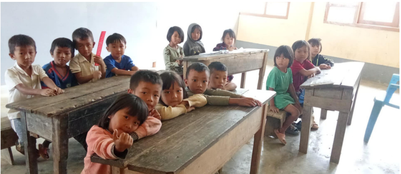
Classroom of Satawm School サタウム村の教室にて