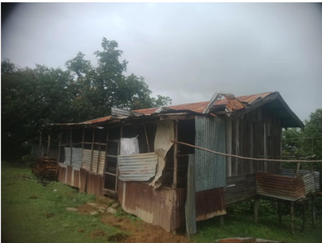
Kindergarden classroom after drone attack ドローンによる爆撃被害を受けた教室